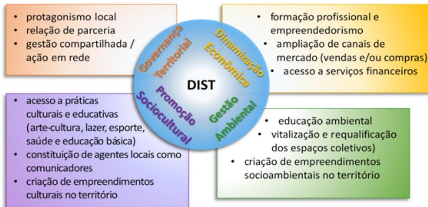
DIST – Diagrama Básico

As Ações a serem desenvolvidas pelo projeto DIST-SHOPPING PARK , foram estruturadas levando em consideração :